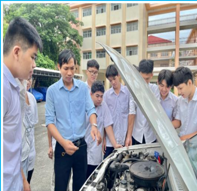
Thực hành bảo dưỡng động cơ ô tô