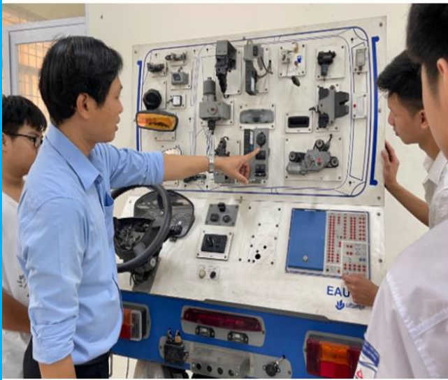
Thực hành hệ thống điện ô tô