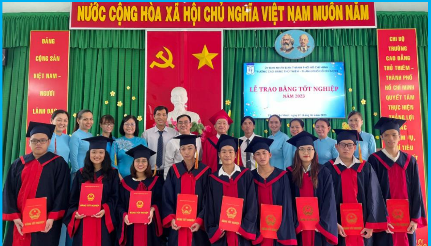
Lễ trao bằng tốt nghiệp năm học 2022-2023