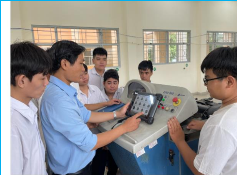
Thực hành dùng thiết bị chẩn đoán ô tô