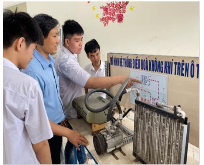
Thực hành hệ thống điều hòa không khí trên ô tô