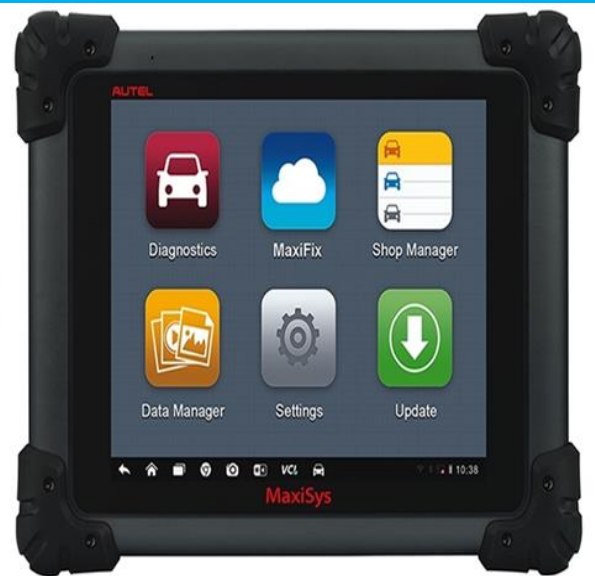
Autel MaxiSys MS908S Pro