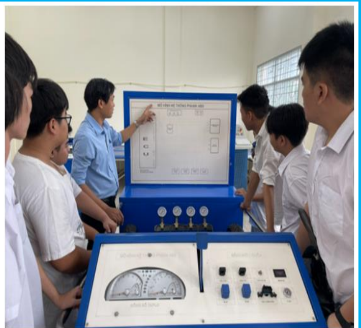
Thực hành hệ thống phanh ABS